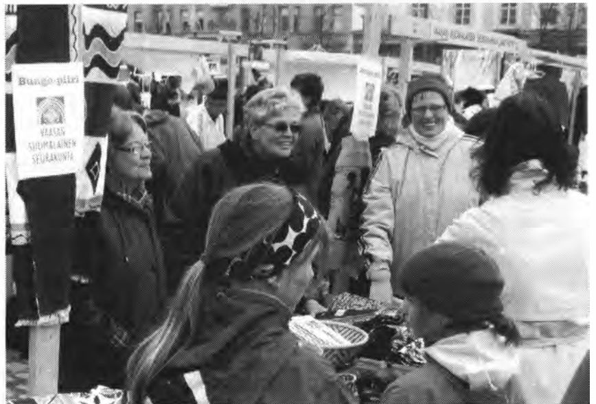
Mahdollisuuksien tori Vaasassa.

Vaasan ja Morogoron välinen yhteistyö alkoi Vaasan ja Morogoron ystävyyskaupunkisuhteena. Mukana olivat niin kaupunginvaltuusto, seurakunta kuin lääkäritkin. Kaupungin ehdotuksesta perustettiin kehitysmaaseura, joka on toteuttanut parinkymmenen vuoden aikana monenlaisia pieniä hankkeita. Viime vuosina yhteistyötä on lisännyt uusi, ulkoministeriön rahoittama kuntien välinen yhteistyö.