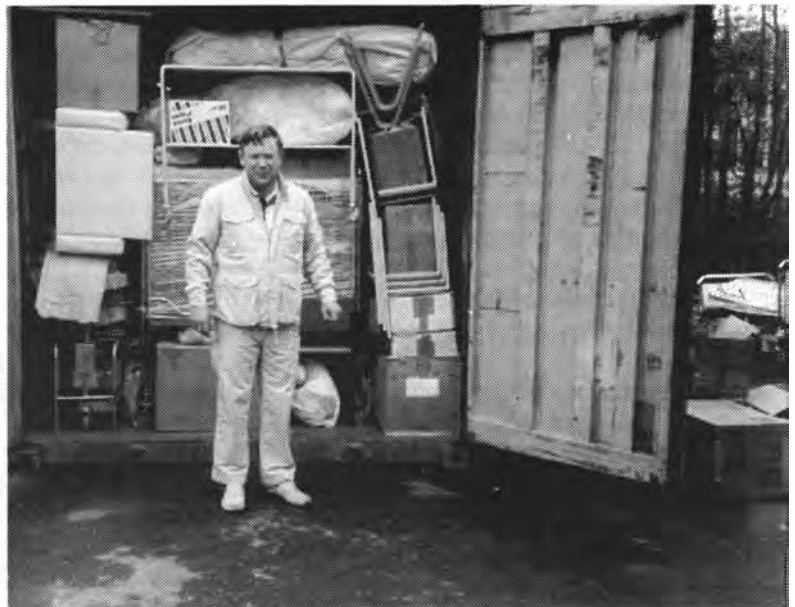
Pari vaasalaista laatikkoa mahtuisi vielä.

Yksi parhaista tätä valaisevista esimerkeistä oli kysymys kuumasta vedestä. Sitä ei ollut, hoitajat eivät halunneet pestä käsiään kylmällä vedellä ja hygieniä kärsi. Kehitysmaaseuralaiset ehdottivat, että katolle voitaisiin laittaa mustaa letkua, jossa vesi lämpiäisi. Vaasalaiset lähtivät toteuttamaan ideaa innostuksen vallassa perehtymättä kunnolla taustaan.