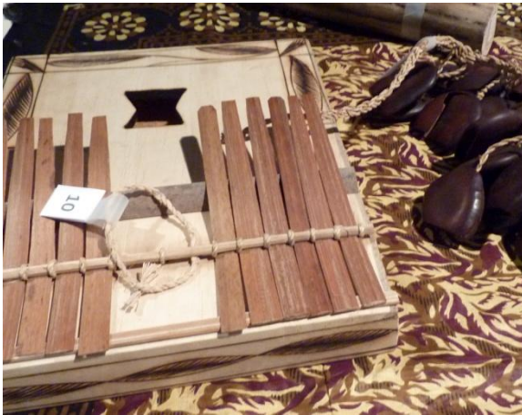
Peukalopiano eli mbira, ylhäällä osa sadetikusta ja oikealla säärihelistimestä.

Elokuisessa Uhusiano-seminaarissa oli luentojen ohella järjestöjen toiminnalliset esittelypisteet, joissa yleisö sai koota palapelinä Afrikan kartan, tutustua kummilapsitoimintaan, tutkia mikroskoopilla malaria-loisiota, arvata soittimien nimiä ja ostaa kalimban, shekeren tai muun soittimen, käsitöitä – ja tietysti arpoja.