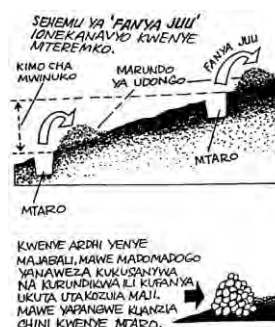
Kuvitus DOVAP:in manuaaliin maan terassoinnista (1996).

Kattin voimavara on tansanialaisten kansantyyppien tarkka kuvaaminen, hänen piirtämänsä hahmot elävät ja tuovat sarjakuvatarinaan aitoutta ja uskottavuutta. Juuri tällaista tiedotusmateriaalia järjestöt haluavat käyttää, mutta ei ole aina helppoa löytää sopivaa piirtäjää. Varsinkin humoristinen Kulakunoga -sarjakuva oli erittäin suosittu. Sitä julkaisi Morogoron maanviljelijä-yhdistys Pambazuko -lehdessä.