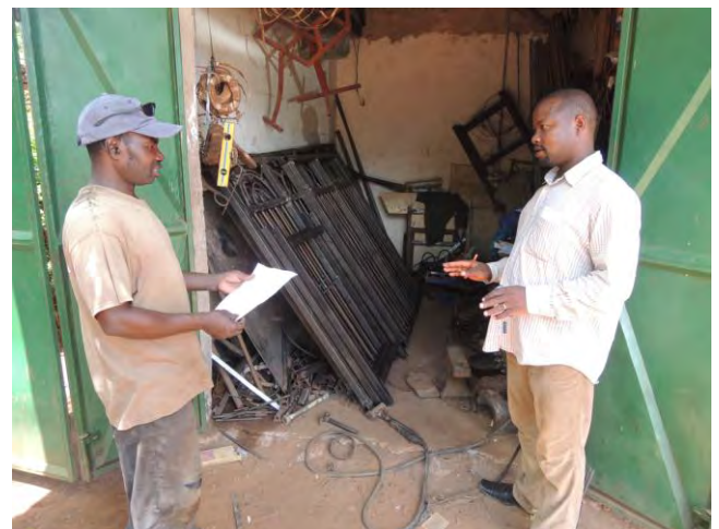
Työnjohtaja Bbaga keskustelelee työntekijänsä kanssa.

Irja Aro-Heinilän materiaalista muokannut Elina Puhto