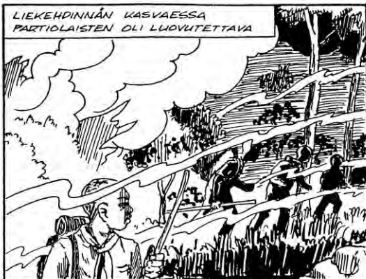
Ruutu sarjakuvasta "Tuhoisa palo", joka julkaistiin suomeksi, englanniksi ja swahiliksi (1990).

Katti tuli tänne mielellään, mutta ei koskaan viihtynyt, vaikka isäntäväki ja suomalaiset tutut yrittivät parhaansa. Vapaa-ajat hän vietti moskeijassa tai Akateemisessa kirjakaupassa, mistä hän osti lähinnä tietotekniikkaa käsitteleviä kirjoja. Matkat Suomeen ja Ruotsiin ovat hänen ainoat ulkomaanmatkansa.