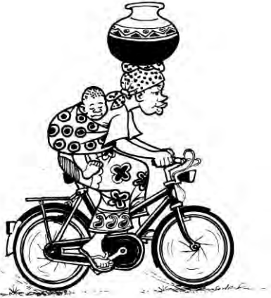
Karibu Tansania -julkaisun kansikuva