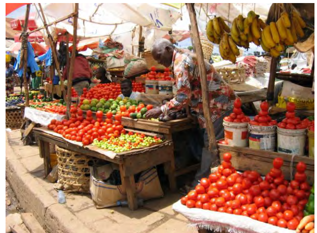
Vihanneskauppiaita Morogoron torilla

kansalaisyhteiskunnan asiantuntija Kegan Tansanian-maatoimisto