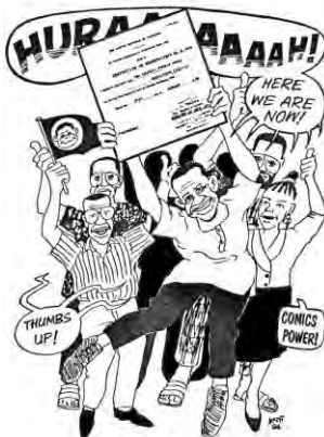
Karibu Tansania! -oppaan kansikuvapiirros (2002).